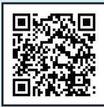
▲家庭ごみ分別早見表

《開設日》月曜日・火曜日・木曜日・金曜日・土曜日(午前10時～午後3時)(祝日も開設します) ※水曜日、日曜日、12/29～1/3は休みです。 《場所》岐南町平成6-110 (株)高島衛生 敷地内 ☎058-248-0089