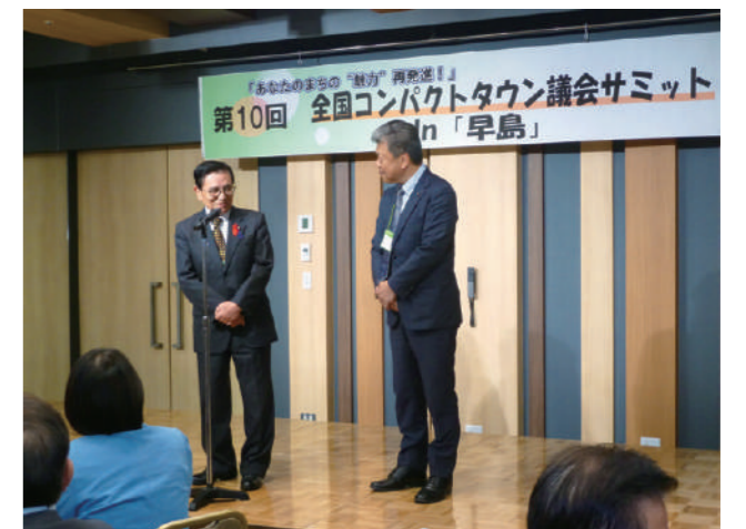
ホテルグラン・ココエ倉敷での一幕

コンパクトタウン議会サミットとは、自治体面積20km 2 以下の町を対象に、合併をしないで自立を選択した各町の議員が集まり、コンパクトな町ならではの課題や政策を持ち寄り、議論や交流を通じ、その違いや共通点を発見することで各町のまちづくりのヒントを見つける場です。来賓に岡山県知事をはじめ近隣の首長を迎え、盛大に行われました。