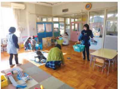
楽しく遊んでいる子どもたち