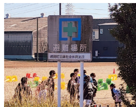
羽栗社会体育施設(羽栗グラウンド)

長は事業費も高額となることから、国の社会資本整備総合交付金を活用し、令和6年度以降の交差点改良を含む、道路改良工事を予定しています。 Q 取得から2年近く経過した。現時点で具体的な活用や運用方針はどのようになっているか。 A (住民部長) 購入により、管理する上での意思決定は町単独でスピーディーに行えるようになりましたが、現時点では具体的な活用・運用方針は決まっています。町の活性化を視野に入れながら、幅広い世代の使用が図れるよう、将来を見据えて着実に進めていきます。