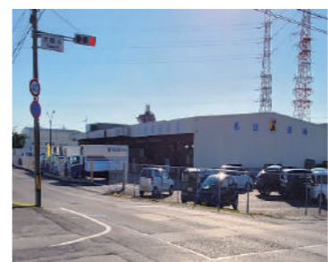
【お成り街道】上に在る「伏屋4」交差点

Q 伏屋4交差点より西側は下水道・道路整備が完了しているが、獅子舞会館やグラウンドが隣接する、東方面の道路整備は。 A (土木部長) 交差点を挟む町道部分は未改良で幅員も狭く、通行に一部支障が生じています。交差点東西の道路整備計画延