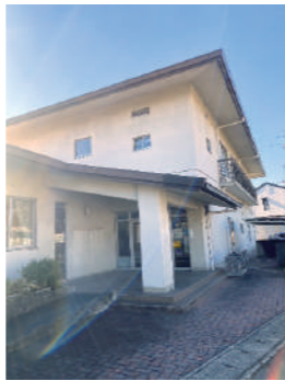
東町民センターでは通常約150名の子どもたちが利用

Q (福祉部長) 東小学校の増築に関する設計当時、東学童の児童数は、平日利用の学童は年平均80名に満たず、東町民センター内で余裕をもって保育が可能であったため、空き教室の活用などの議論はありませんでした。教育委員会に対し、東小学校の将来の空き教室の利用の可能性について協議したところ、児童の増加が今後も見込まれることから、学童保育としての活用は難しいとの認識で一致しています。東学童の利用者増加に対応するためには、利用者に対する募集要件の変更だけでは限界があることから、現在利用している東