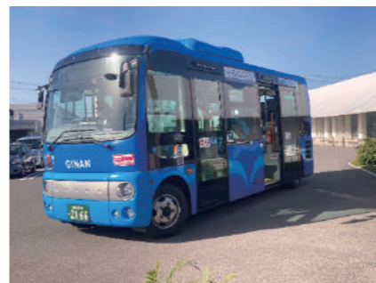
コミュニティバス

A (教育長) 何かの理由から日頃の手段で登校できない場合はバス利用も可能です。