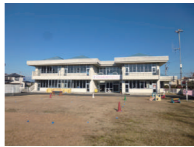
多機能型地域子ども安心センター

A (福祉部長) 集団生活に馴染めない子どもを対象に事業運営を行っていますので、引き続き、各保育施設と連携・協力し、対象児童の把握・支援に努めます。