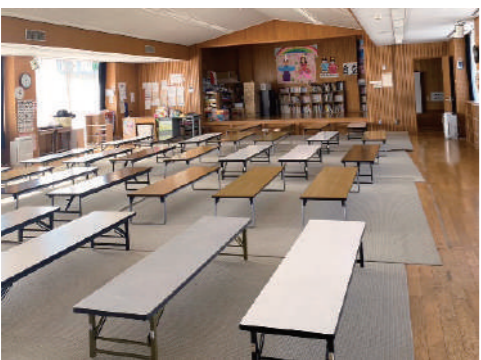
学童は長期休業さらに利用人数が増えます早急な対応が望まれます

Q 子ども子育てを推進するこの時代に、今まで継続していた一律預かりをやめるのなら、まずは他の事業で補完すべきだったのではないか。特に東は早急に対応が必要。学校では学童の実施が難しいとされ、学童の利用制限にまで至っているのだから、明らかに東の居場所事業の実施が最優先ではないか。北のほほえみ会館の改修を優先するのであれば、状況把握できているとは思えない。この課題についてどのように解決するのか。