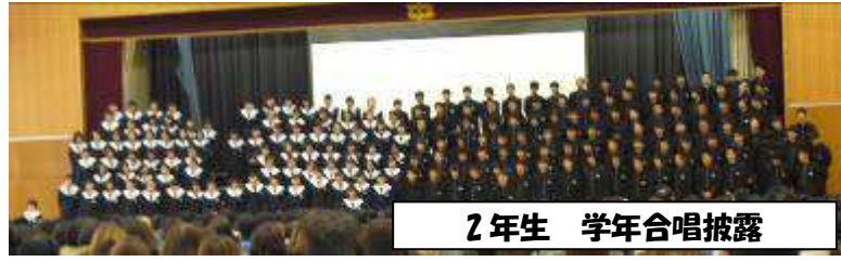
2 年生 学年合唱披露

今日は、新 1 年生半日入学がありました。後期生徒会の中でも大きな行事の一つです。その中の生徒会の発表は成功してうれしかったです。1 回もかまわずに止まらずに、わかりやすく自分自身できたのでよかったです。半年前と比べると本当に成長したと思います。記憶力もそうだし、頭の中でちゃんと整理ができていいるから、堂々と話せるようになったと思います。（2 年生 生徒感想）