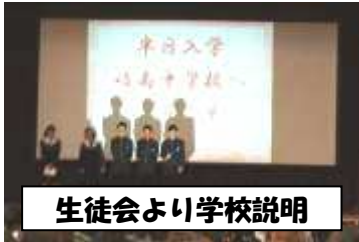
生徒会より学校説明