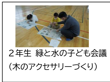
2年生 緑と水の子ども会議 (木のアクセサリーづくり)