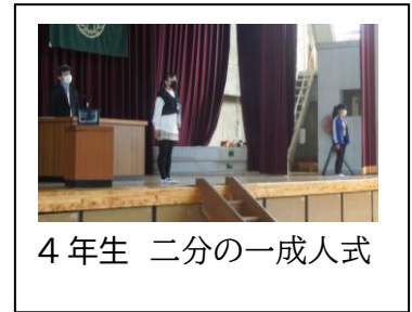
4年生 二分の一成入式