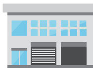
指定緊急避難場所