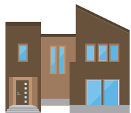
自宅の浸水しない階 ※4