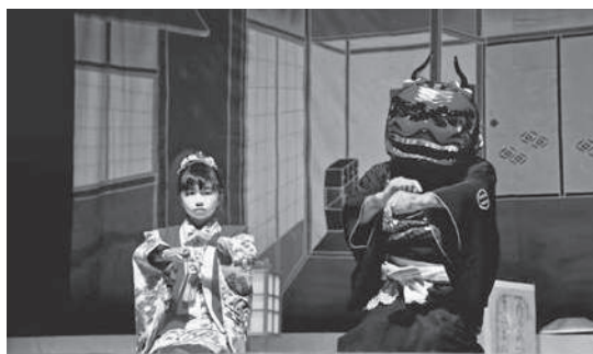
▲子役の演技にも注目!

ぎふチャン『生放送 ぎふナビ!』の岐南町のコーナー「ローカルスター(地域の星)を探して 岐南 まちぶら探検隊」は、次の放送が本年度の最終回です! 今回は、会場から生中継で、獅子芝居の様子をお届けします。獅子舞のショートムービー2本も好評公開中! ぜひ、ご覧ください。