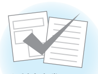
添付書類の 省略ができる！