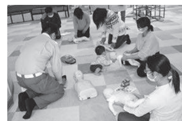
「子供を守る!救命講話」(12月開催)

・利用前に親子ともに検温し、体調を確認します。 ・咳や発熱、風邪症状がある場合は、利用を控えてください。 ・利用する場合は、必ずマスクの着用(できる限り子どもも着用)をお願いします。 マスクは各自でご用意ください。なお、サロン利用中は、こまめに手洗いや手指のアルコール消毒をお願いします。