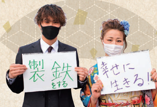
新成人の集い実行員会の皆さん