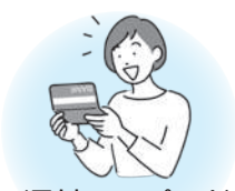
還付のスピード が早い！