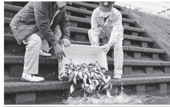
▲マブナの放流の様子

境川では、放流したマブナ以外にナマズなども生息しています。これからも魚が住みやすいきれいな川が保たれるように、大切にしていきたいと思います。