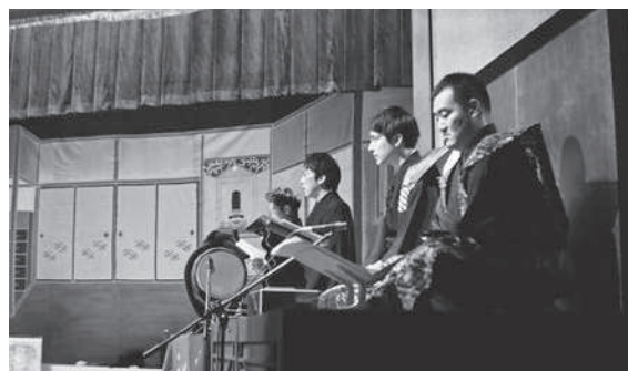
▲おはやしが芝居の情緒を深めます

番組名：生放送 ぎふナビ! 放送局：ぎふチャン(岐阜放送) 放送日時：2月18日(金)午後8時から