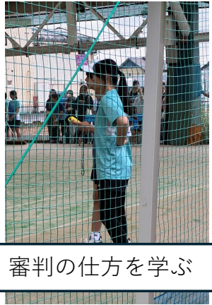
先輩から後輩へ。審判の仕方を学ぶ