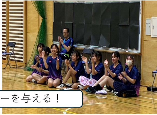
仲間にパワーを与える！